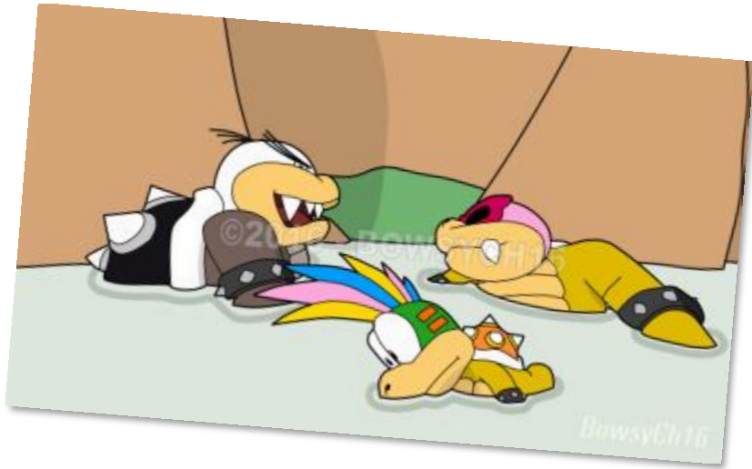
Quelques dessins réalisés. / Some drawings I made. (Ombre ajoutée / Shadow added)