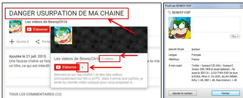
Les indices de la fausse chaîne et de l'usurpation (juillet 2015) – Sans truccages...

Conscient des problèmes d'usurpation, il prévient l'ensemble de la communauté (même si certains s'en moquent, notamment Olaf (avec un reproche sur le forum – Il convient de rappeler que BowsyCh16 n'aime pas la critique négative)).