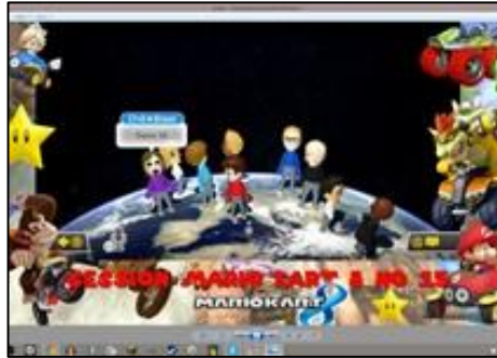
Son soi-disant affichage. Un air de ressemblance, non ?

Ce que les membres principaux de MK8 (y compris BowsyCh16) reprochent à Deriuh est son immaturité, son kikoololisme aggravé, son manque de créativité (d'où il copie) et sa façon de « coller » certaines personnes.