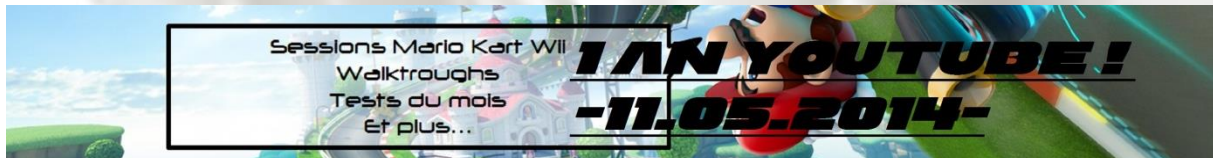
Figure 4 La bannière simple (mais que jugée médiocre) pour ma première année sur YouTube !

11.05.2014 – Inscrit le 11 mai 2013 sur YouTube, la chaîne fête sa première année d'existence. La vidéo spéciale n'est pas la meilleure produite mais retrace l'histoire de la chaîne étape par étape.