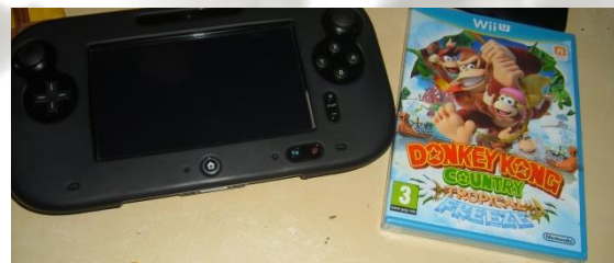
Figure 3 Un jeu encore sous blister... et un GamePad !

25.02.2014 – Dans l'attente de la sortie de Mario Kart, la décision est prise de faire l'achat de DKCTF tout simplement... pour ses musiques ! On remerciera essentiellement le travail de David Wise qui a su nous faire un travail digne et remarquable de sa personne ! La qualité graphique a également eu son mot à dire : bonne réalisation !