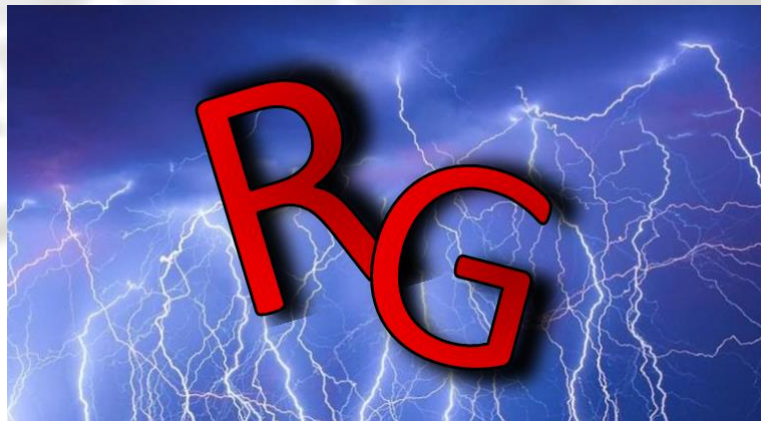
Figure 7 Le logo de la team « Les Rageux »

Fin décembre – Un grand débat fait rage. En cause, un banni lance des propos véridiques sur le site, mais que la plupart des membres contestent. Les flammes s'élèvent, montrant le conflit grandissant.