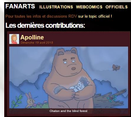
Figure 1 Exemple de Fan-Art (19.04.2015)